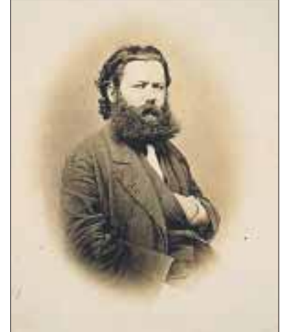
Henrik Ibsen (Foto von 1863)

Im CAP Ettelbrück „Hedda Gabler“, von Henrik Ibsen