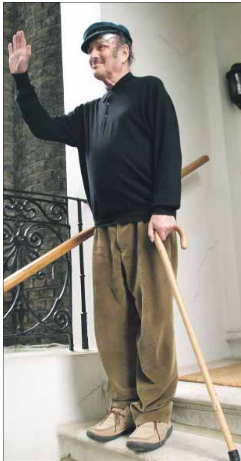
Der immer noch kämpferische Pinter winkt Journalisten zu, nach ersten Interviews am Tag der Nobelpreisvergabe