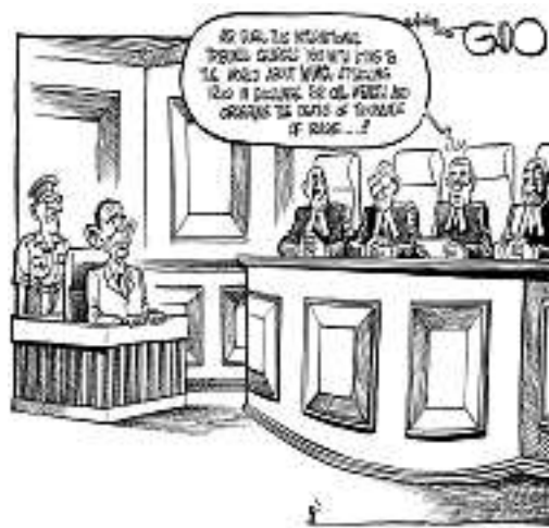
Wie Gado Bush vor Gericht sieht

Man schätzt, dass in ihnen über 25.000 Menschen weiterhin ohne Prozess und Anklage gefoltert werden und dahinvegetieren. Von vielen hat man seit Jahren nichts gehört. Wo sind sie? Wohl in den Geheimgefängnissen, die die CIA gemeinsam mit den Machthabern in Jordanien, Ägypten, Tunesien, Marokko unterhält, in denen es zum Einsatz von Elektroschocks und zum Begraben bei lebendigem Leib kommt?